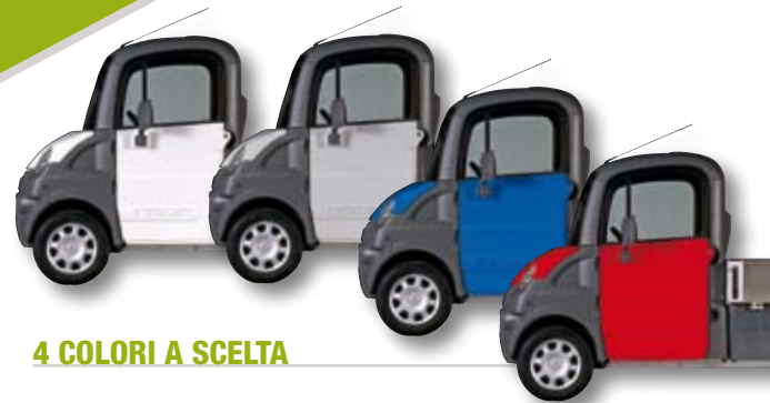
4 COLORI A SCELTA