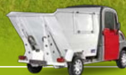
Versione con Vasca Nettezza Urbana

➤ CARICO E VOLUME UTILI : fino a 680 kg - fino a 3 m 3