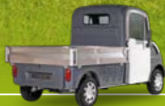
Versione Doppio Pianale