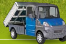
Versione Pianale Ribaltabile